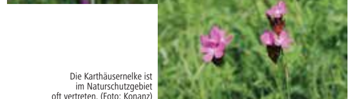
Die Karthäusernelke ist im Naturschutzgebiet oft vertreten.