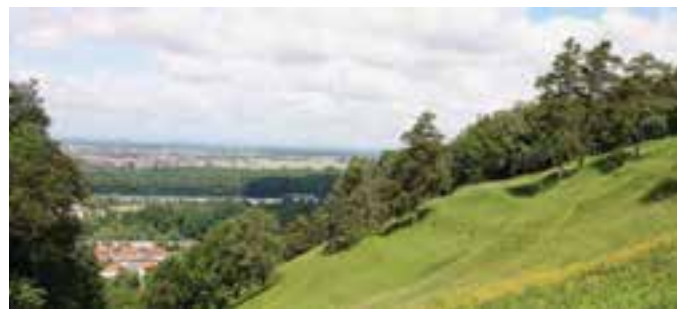
Südhang des Naturschutzgebiets Kaiserberg. Der Lössboden des ehemaligen Rebgeleändes ist mit Trockenrasen bedeckt. Der Boden kann bis zu 70°C warm werden.

Ein mystischer Berg, um den sich auch so allerlei Sagen weben und der bereits in vorchristlicher Zeit Schauplatz heidnischer Götterverehrung gewesen ist. Da soll beispielsweise ein grülicher Drache auf der Bergkuppe sein Unwesen getrieben haben, ehe er von Mönchen und durch den Bau einer Kapelle gebannt wurde. Genau jene Kapelle thront heute noch unübersehbar auf der Spitze des Berges, weithin sichtbar. Und es ist wohl kein Zufall, dass diese Kapelle von Anfang an dem Erzengel Michael, dem Bezwinger des Luzifer, dem Sieger über das Böse, geweiht ist.