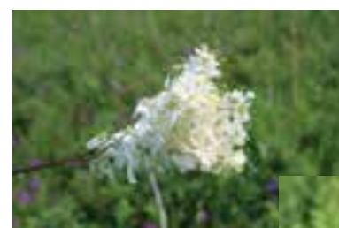
Die Wiesenkönigin ist eine Heilpflanze – vermutlich ausgesetzt.

Im unteren Hang steht auf kleiner Fläche ein wärmeliebender, niederwüchsiger Eichenmischwald mit lockerem Kronendach. Neben ihm und im oberen Gebietsteil findet sich eine artenreiche Buchenwaldgesellschaft, zu deren Charakteristika eine schwach ausgebildete Krautschicht mit Maiglöckchen, Waldbingelkraut und Goldnessel zählt. Eine Artenvielfalt an Blütenpflanzen und Tieren, die ohne Zweifel ihresgleichen sucht und die daher auch unter überaus strengem Schutz steht, weshalb dort auch keine Blumen gepflückt werden dürfen.