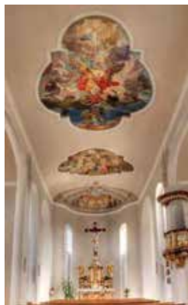
Die in barocker Nachahmung geschaffenen Deckengemälde beleben das Gotteshaus. Die bildlichen Darstellungen beinhalten dabei alle das Wirken von Engeln.

Michaelis Archangeli, so hieß die erste, 1346 schriftlich erwähnte Michaelskapelle, die 1472 zunächst eine gotische und zur Mitte des 18. Jahrhunderts eine barocke Nachfolgerin erhielt. Kardinal Damian Hugo von Schönborn, Fürstbischof zu Speyer, war es, der die Kapelle in ihrer heutigen Gestalt 1742 bis 1744 errichten ließ. Was heute das barocke Innenleben der Kapelle ausmacht – Hochaltar, Kanzel, die beiden Seitenaltäre –, wurde nach der Säkularisierung aus anderen Kirchen wieder ergänzt. Ebenso die imposanten neobarocken Deckengemälde, die erst Anfang des 20. Jahrhunderts geschaffen wurden: Der Sturz des Luzifer in die Flammenhölle, der Triumph des Erzengels Michael. Eindrücklich hat der Künstler Joseph Mariano Kitschker diese viel zitierte Textpassage aus der Offenbarung des Johannes in seinem zentralen Deckengemälde illustriert. Auch die anderen Darstellungen in der St. Michaelskapelle sind biblischen Engelszernen gewidmet oder greifen Motive aus christlichen Heiligenlegenden auf, in denen Engel eine zentrale Rolle zukommt.