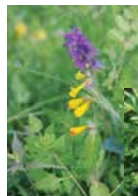
Der Hain-Wachtelweizen mit gelb-blauen Blüten. Bis vor Jahren noch war der Kaiserberg sein einziger Standort.