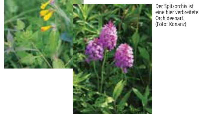
Der Spitzorchis ist eine hier verbreitete Orchideenart.