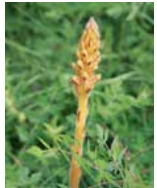
Maximal 5-mal gibt es die Nelken-Sommerwurz, eine Schmarotzerpflanze mit Nelkengeruch.