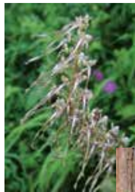
Die selten vorkommende Bocksriemenzunge mit ihren zungenartigen Blüten duftet nach Ziege.

Wer mit dem Pkw kommt, sollte auf die Kuppe hinauf fahren, um auf dem Parkplatz links vor der Kapelle zu parken. Man kann natürlich auch bei den Parkplätzen am „Heidelesheimer Kreuz“ oder am Solweg beginnen.