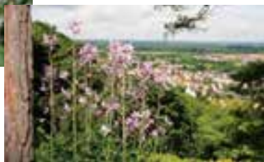
Nach langer „Abwesenheit“ blüht der Diptam wieder, und das in einer so umfangreichen Staude. Standpunkt im Halbschatten unter einer Kiefer, im Tal ist Untergrombach zu sehen.