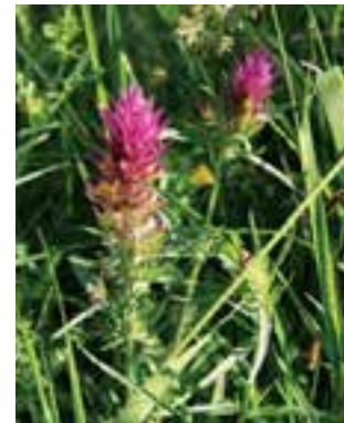
Der Wiesen-Wachtelweizen ist eine gelb-violette und zahlreich vorkommende Pflanze.